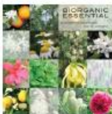
LEAFLET BIORGANIC ESSENTIAL