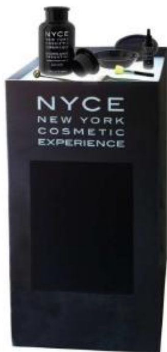
CARRELLO EXPO CHROMO LIGHT