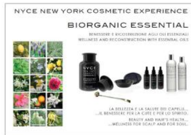
CARTELLO BIORGANIC ESSENTIAL 100X70